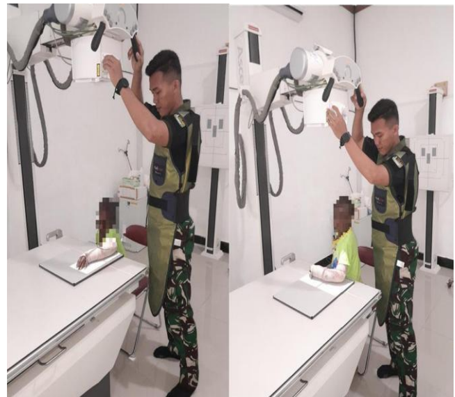
Gambar 1. Pemeriksaan Radiografi Proyeksi PA dan Lateral

Dari penelitian yang telah penulis lakukan, pada pemeriksaan radiografi region antibrachii pada pediatrik dengan kasus Fraktur Tertutup tidak ada persiapan khusus yang perlu di lakukan, sehingga ketika pasien datang ke instalasi radiologi dengan diantar oleh perawat menggunakan kursi roda dan membawa form pemeriksaan yang berisi identitas pasien dan permintaan pemeriksaan radiografi region antibrachii . Kemudian perawat tersebut memberikan form pemeriksaan kepada radiografer, setelah radiografer menerima form pemeriksaan tersebut langkah awal yang dilakukan adalah mengintruksikan pasien untuk menunggu di ruang tunggu radiologi, setelah itu radiografer mempersiapkan kaset ukuran 35x40 yang diletakkan diatas meja pemeriksaan dan menginput data pasien ke dalam kompuer radiologi serta memilih extremitas yang akan diperiksa.