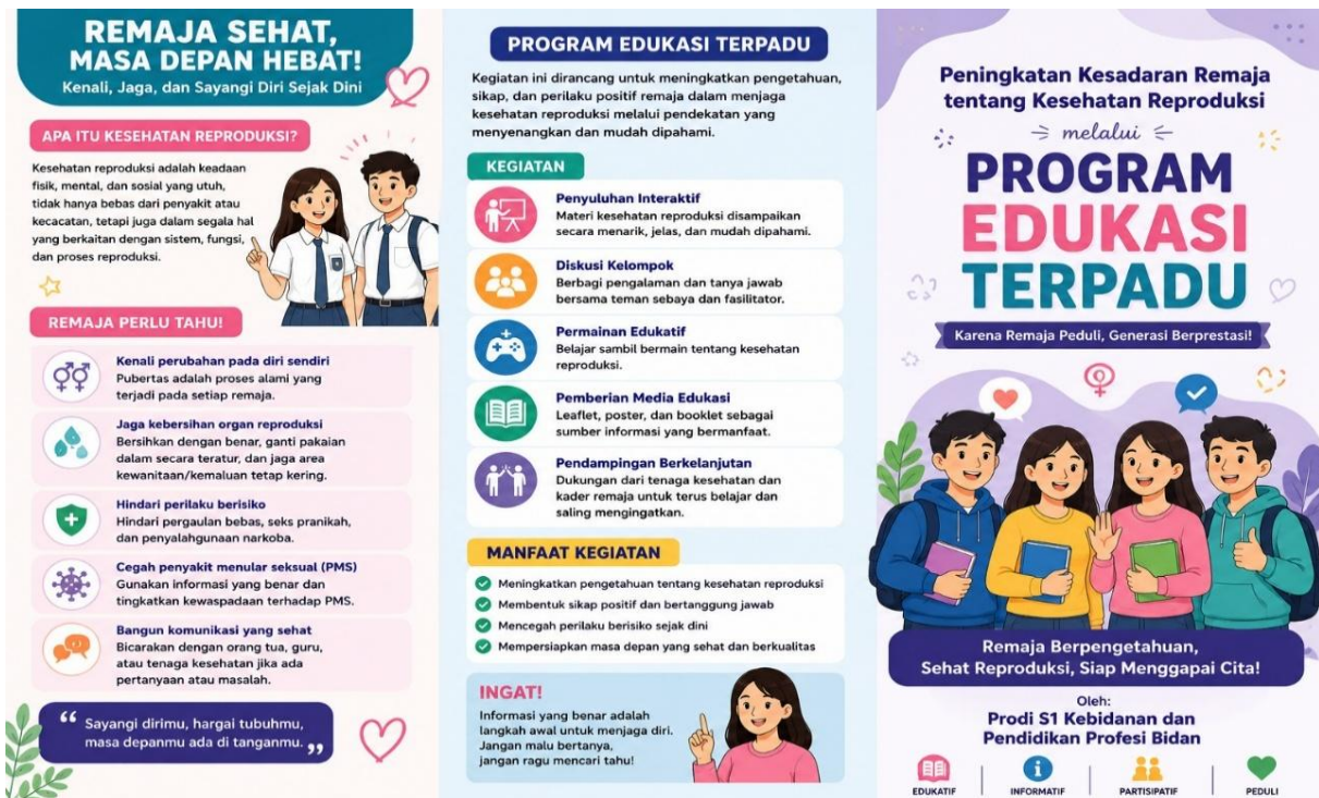
Gambar 2. Leflet Kegiatan Edukasi Peningkatan Kesadaran Remaja tentang Kesehatan Reproduksi melalui Program Edukasi Terpadu