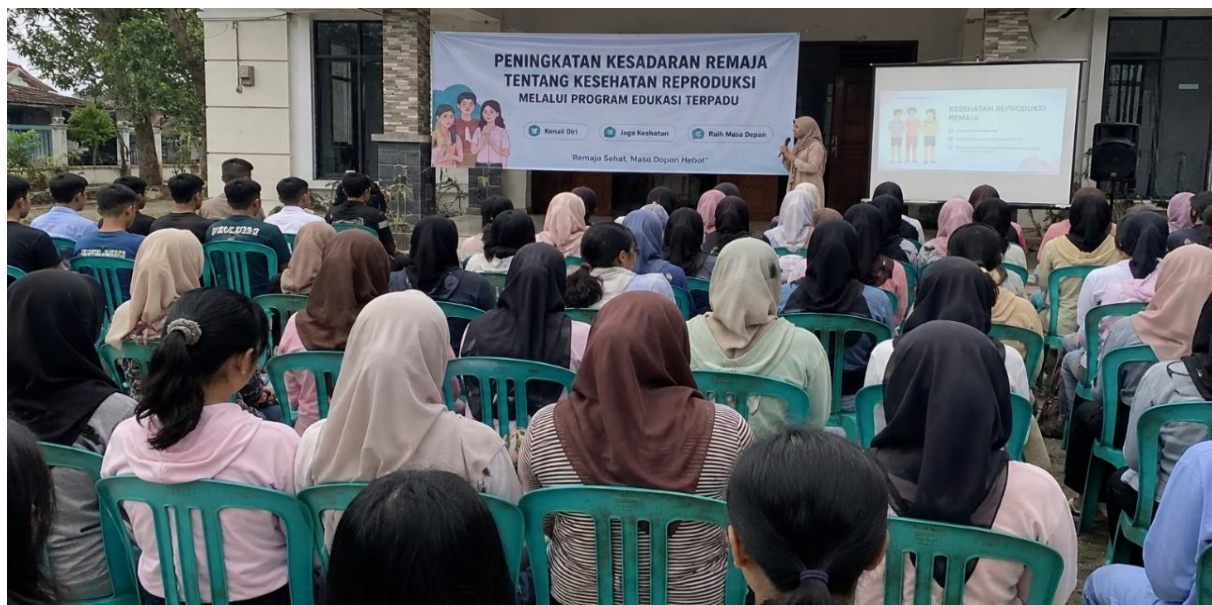
Gambar 1. Kegiatan Edukasi Peningkatan Kesadaran Remaja tentang Kesehatan Reproduksi melalui Program Edukasi Terpadu

Hasil evaluasi menunjukkan adanya peningkatan pengetahuan pada seluruh indikator. Peningkatan terbesar terjadi pada pemahaman mengenai kebersihan organ reproduksi dan perubahan fisik selama masa pubertas. Temuan ini menunjukkan bahwa edukasi yang diberikan mampu meningkatkan pemahaman peserta terhadap isu kesehatan reproduksi yang sebelumnya masih kurang dipahami [19].