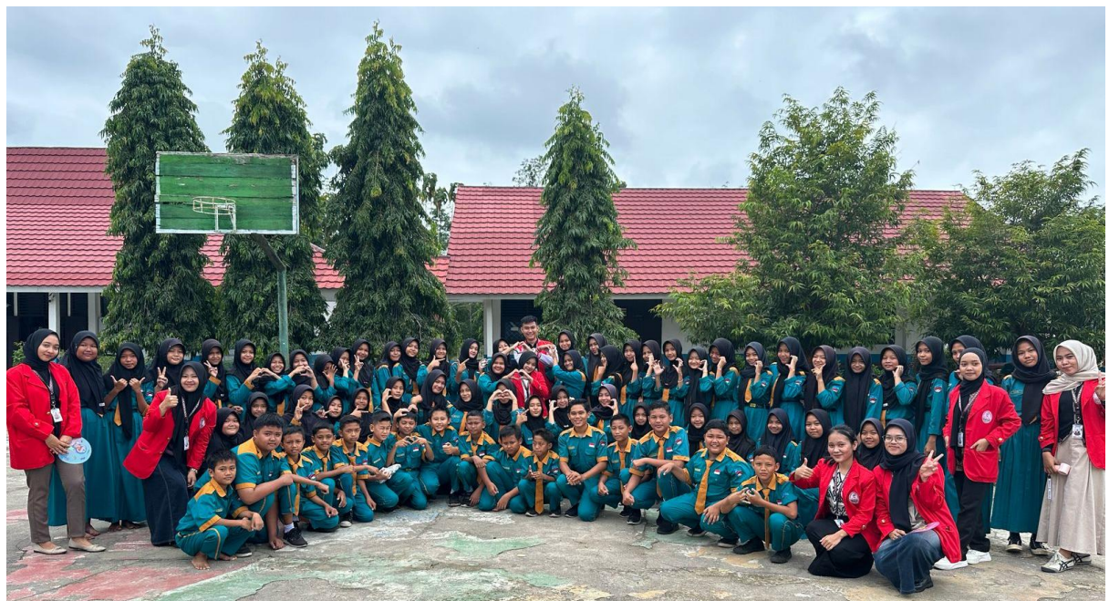
Gambar 3. Foto Bersama Siswa SMP Negeri 2 Penukal

Dalam pendidikan kesehatan, terdapat peningkatan informasi yang dapat memperluas pengetahuan individu, yang pada gilirannya dapat mengubah sikap dan perilaku mereka. Hal ini sejalan dengan tujuan pendidikan kesehatan, yaitu untuk mengubah perilaku (perubahan perilaku) dari yang negatif (tidak sehat) menjadi yang positif (sesuai dengan prinsip-prinsip kesehatan), serta mengembangkan dan mempertahankan perilaku positif yang telah ada [2].