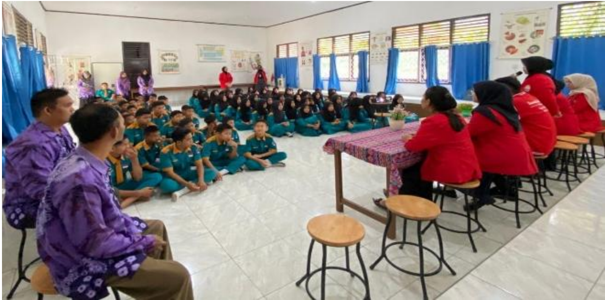
Gambar 2. Pelaksanaan Kegiatan Pengabdian di SMP Negeri 2 Penukal

laki dan perempuan, langkah-langkah yang perlu diambil saat menstruasi, cara menjaga kesehatan alat reproduksi remaja.