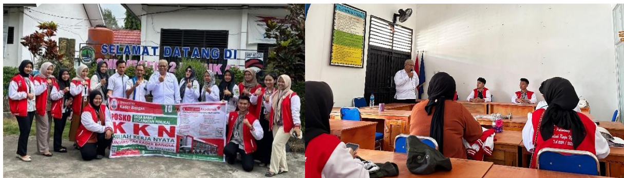
Gambar 1. Foto Bersama Dan Diskusi Denga Pihak Sekolah Smp Negeri 2 Penukal Pada Saat Penjajakan.