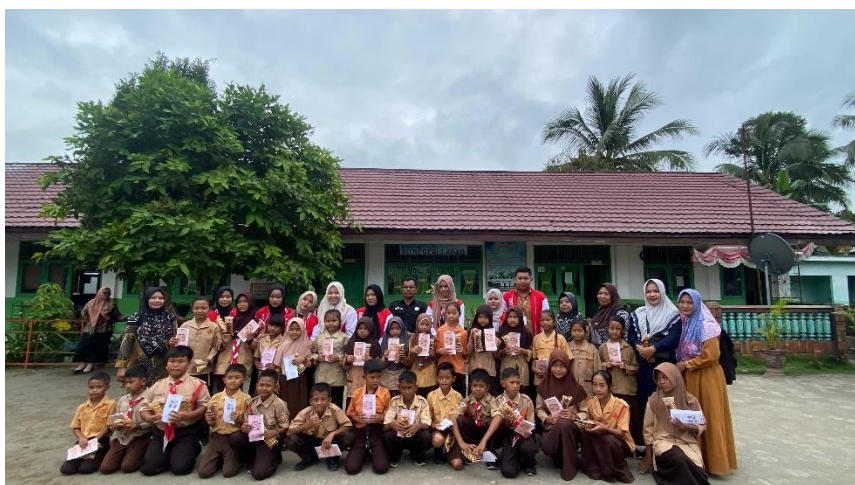
Gambar 2. Dokumentasi Penyuluhan PHBS di SD N 1 Abab