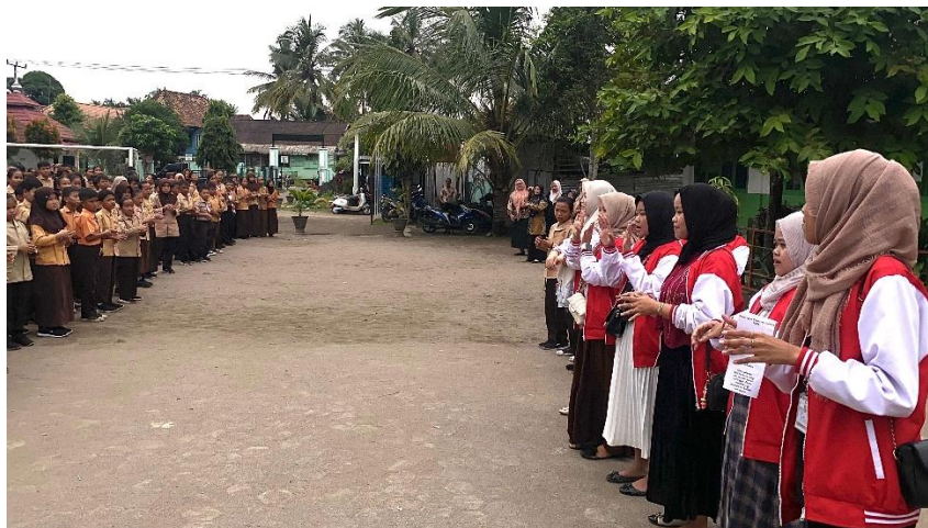
Gambar 1. Kegiatan Penyuluhan PHBS di SD N 1 Abab

Selain peningkatan dalam indikator utama PHBS, observasi selama kegiatan menunjukkan bahwa siswa lebih antusias dalam mempraktikkan kebiasaan hidup sehat setelah mendapatkan edukasi yang bersifat interaktif dan berbasis praktik langsung.